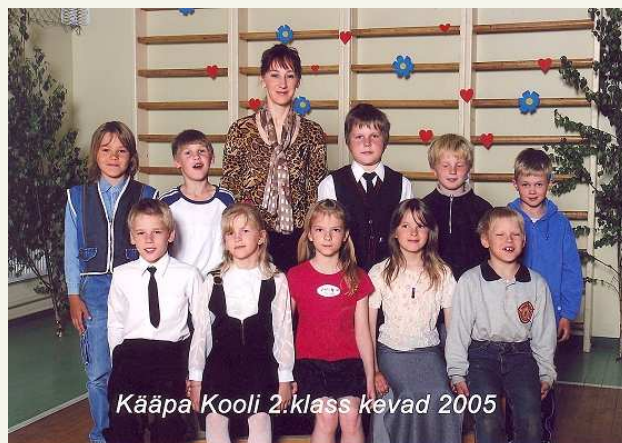
Kääpa Kooli 2. klass kevad 2005