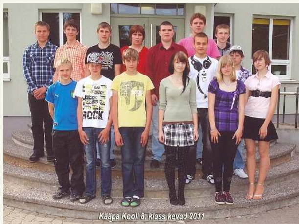
Kääpa Kooli 8. klass kevad 2011