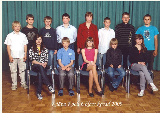
Kääpa Kooli 6. klass kevad 2009

Selles koolis olen olnud 9 aastat. Kääpa kool on super kool. Alates 1. klassist leidsin ma palju uusi sõpru. Need 9 imelist aastat on olnud täis rõõmu ja naeru, kuid ka mõnikord natuke nukrust. Selle aja jooksul olen ma õpinud juurde palju tarkust ja saanud rohkem iseseisvaks.