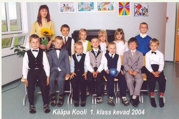
Kääpa Kooli 1. klass kevad 2004

Mulle meenuvad algklassides toimunud õpetaja Aiva korraldatud klassiõhtud, mis toimusid koos vanematega ja koos teise klassiga. Veetsime öö koolis.