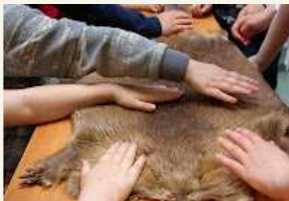
Me katsusime kopra nahka.

Orava pesa on ümar ja tema suurimaks vaenlaseks on nugis.