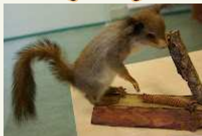
Kopra suurimaks vaenlaseks on jahimees.

Me saime teada, et oravaga on kergesti võimalik sõbraks saada, teda toita ja talle isegi käe pealt süüa anda. Orava lemmiktoiduks on kuusekäbi-seemned.