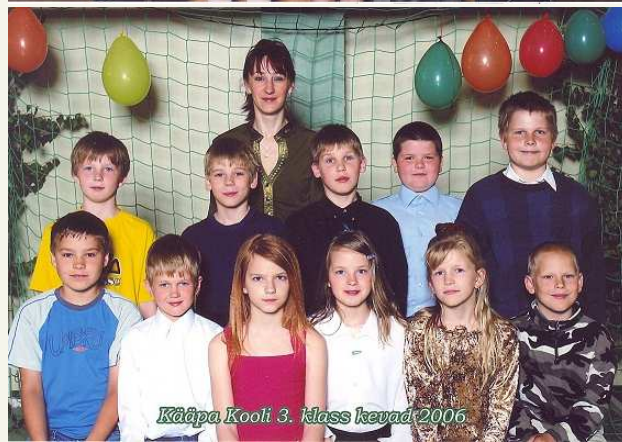
Kääpa Kooli 3. klass kevad 2006