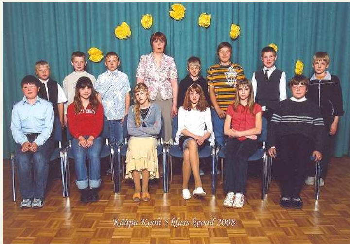
Kääpa Kooli 5. klass kevad 2008

Selle pika koolitee jooksul oleme läbi elanud palju sündmusi ja naljakaid asju. Mängisime pidevalt rahvastepalli – see oli meie lemmiktegevus, hiljem käisime ka võistlustel. Pärast hakkasime mängima võrkpalli.