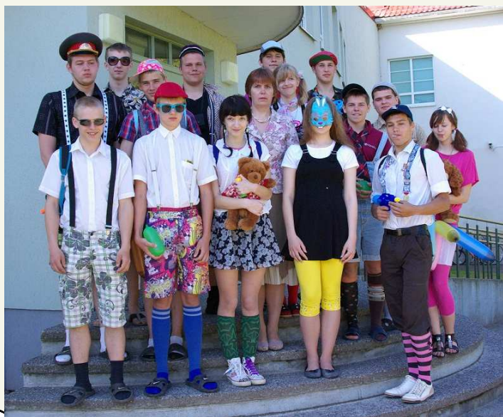
Kääpa Kooli 6. klass kevad 2009

Need üheksa aastat on möödunud väga lõbusalt. Väiksenä olime väga tublid rahvastepallurid. Tublid oleme olnud ka jalgpallis ja võrkpallis. Kõik ekskursioonid, kus me käinud oleme, olid väga toredad ja lõbusad – juhtus igasuguseid lolle asju.